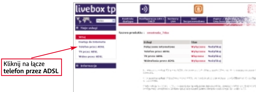
Rysunek 8. Panel konfiguracyjny modemu livebox tp

W nowym oknie wyświetlony będzie status usługi telefonia internetowa tp . Jeśli usługa będzie włączona, na stronie będzie się też znajdował numer telefonu, który został przydzielony do usługi (Rysunek 9.).