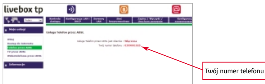
Rysunek 9. Strona panelu konfiguracyjnego modemu livebox tp z włączoną usługą telefonia internetowa tp

W nowym oknie wyświetlony będzie status usługi telefonia internetowa tp . Jeśli usługa będzie włączona, na stronie będzie się też znajdował numer telefonu, który został przydzielony do usługi (Rysunek 9.).